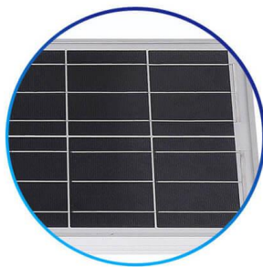
Panel Solar Policristalino