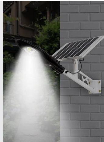
ENCIENDE AUTOMÁTICAMENTE EN LA NOCHE