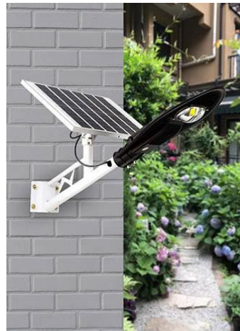
CARGA DURANTE EL DÍA