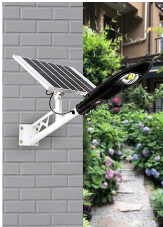
CARGA DURANTE EL DÍA