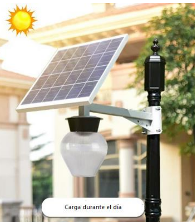
Carga durante el día