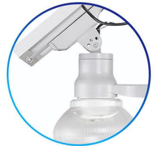
Carcasa en Aluminio IP65