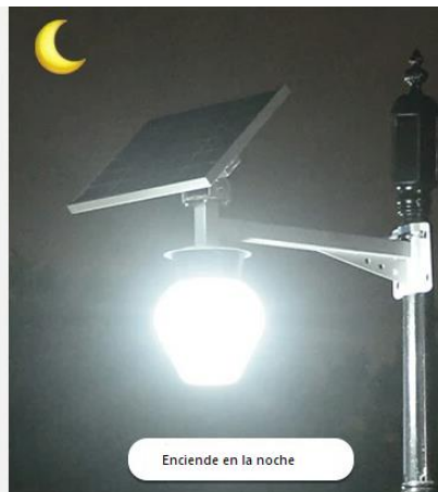
Enciende en la noche