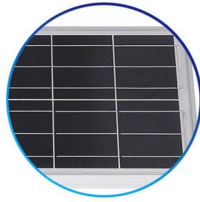
Panel Solar Policristalino