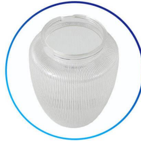
Disfuser de PMMA